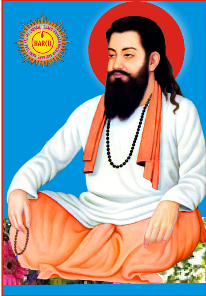
Jagatguru Ravidass Ji Maharaj